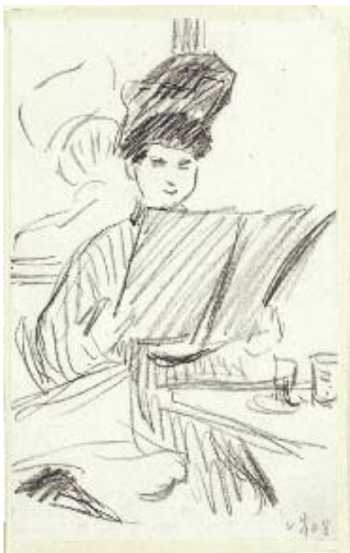
8. Václav Špála, V kavárně – čtoucí dáma , 1908, tužka, papír, Národní galerie v Praze