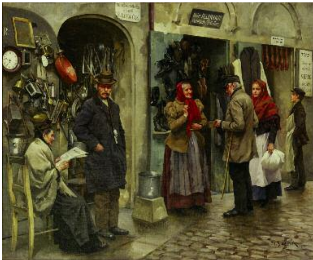
6. Vojtěch Bartoněk, Z pražského ghetta , kolem roku 1890, olej, plátno, Židovské muzeum v Praze

Na přelomu 19. a 20. století došlo v Praze k rozsáhlé asanaci a centrum města prodělalo zásadní proměnu charakteru městské zástavby. I ve 20. století se na českých výtvarných dílech z městského prostředí objevují čtenáři tisku, jako je tomu třeba na malbě Antonína Procházky Ulice (1926, Galerie výtvarného umění Zlín) nebo na kresbě Huga Boettingera Dva čtenáři Politiky (dvacátá léta 20. století, Památník národního písemnictví). Tavík František Šimon za inspirací cestoval po světě, a tak se rovněž z období první republiky zachovala jeho grafika Wall Street (1927, Galerie Středočeského kraje), která zobrazuje novinového čtenáře na ulicích americké metropole New Yorku.