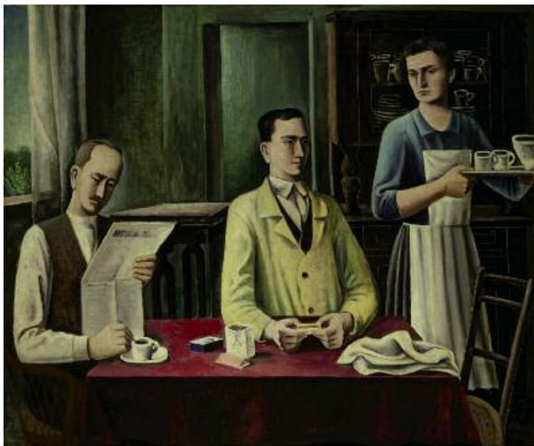
3. František Muzika, Rodina , 1924, olej, plátno, Národní galerie v Praze

ných osob. Dáma sedí za stolem, na němž je rozložen papír a kniha, v pravé ruce drží pero, levou si podpírá hlavu a dívá se na muže sedícího v klubovce po jejím boku. Muž v rukou drží rozložené noviny a přes brýle se dívá na ženu. Marold zachycuje okamžik, kdy se obě postavy přestaly věnovat čtení a sdílejí své myšlenky v hovoru. Čtenářské náměty ze soukromého prostředí nacházíme i na dílech 20. století, přičemž mezi ty nejvýznamnější patří bez pochyby malba Rodina (1924, Národní galerie v Praze) Františka Muziky. S modernizací české společnosti na přelomu 19. a 20. století nabývala ritualizace získávání informací z periodického tisku na významu. Muzika nejenže zaznamenává onen rituál, ale jeho dílo je rovněž ideálním příkladem zobrazení dvojice káva–noviny, která bude detailněji rozebrána v další části tohoto textu.