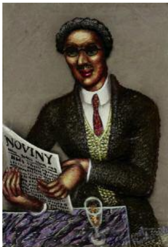
9. Antonín Procházka, Noviny – Čtenář novin , 1927, olej, lepenka, Oblastní galerie v Liberci

V kontextu celého výzkumu vztahu médií a výtvarného umění, respektive zobrazování médií v dílech českého výtvarného umění, jsou kavářské náměty těmi, kde se nejčastěji setkáváme s ženskými postavami. Zatímco na přelomu 19. a 20. století je žena na obraze většinou pouze přisedící muže-čtenáře – tak, jak to zobrazil Tavitík František Šimon na svém leptu V kavárně (1905, Národní galerie v Praze), za první republiky již nalzáme řadu individuálních i skupinových ženských portrétů. Ikonickým příkladem je malba Miloslava Holého Kavárna Unionka (1925, Galerie moderního umění v Hradci Králové), kde ačkoli žena sedí vedle muže a jedná se v zásadě o dvojportrét, divákovu pozornost upoutá čtenářka na první pohled – svým zjevem, výrazným oblečením a kloboukem, stejně jako výrazným gestem držení novin. Přisedící muž s novinami položenými na stole a nepřítomným pohledem je zde bezpochyby postavou vedlejší. Holého malba je výjimečná i tím, že patří k menšině výtvarných děl, na kterých lze identifikovat i konkrétní novinový titul – žena na obraze, spisovatelka, novinářka a překladatelka Helena Malířová, čte Lidové noviny , které za první republiky patřily mezi periodika určená zejména inteligenci sympatizující s politikou Hradu (Bendová, 2008, s. 63). Ženy tehdy dosáhly rovných práv, hromadné možnosti studovat a celkového přístupu k účasti ve veřejném životě (Kárník, 2003, s. 439).