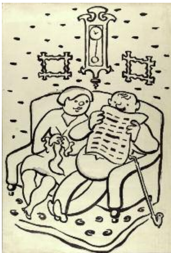
4. Josef Čapek, Čtenář novin, dvacátá léta 20. století, tuš, běloba, papír, Galerie Středočeského kraje

být také již výhradně mužským prvkem, byť mužští čtenáři i nadále na uměleckých dílech převažují. O pestrosti čtenářského námětu vypovídá i několik kreseb, které v tomto období vznikly. Josef Čapek na svém Čtenáři novin (dvacátá léta 20. století, Galerie Středočeského kraje) zobrazil muže, otce, manžela, který si vychutnává čtenářskou chvíli na pohovce po boku zvědavé manželky, jež mu při pletení do jeho výtisku nakukuje. Podobný pohled do rodinného soukromí zachytil i Václav Špála na kresbě Čtoucí muž (dvacátá léta 20. století, Galerie Středočeského kraje) nebo Cyril Bouda na grafice Rodiče (1937, Galerie umění Karlovy Vary).